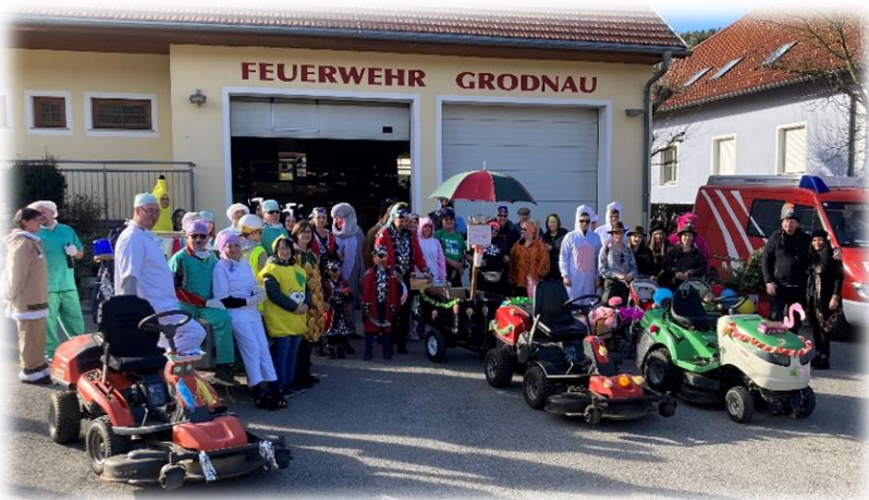
Faschingsumzug am 18.02.2023 in Grodna

Die Kinder der Volksschule und des Kindergartens Mariasdorf besuchten am Faschingsdienstag das Gemeindeamt.